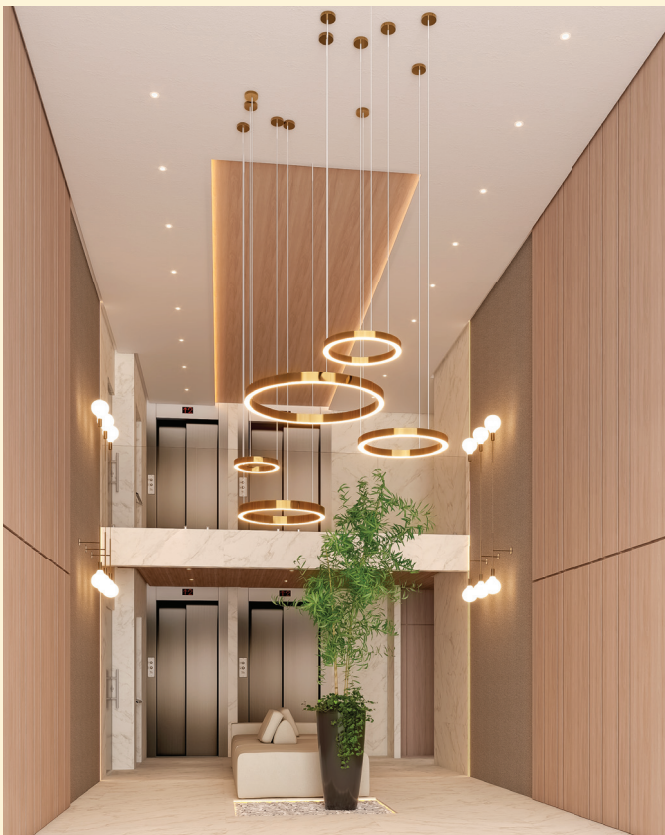
HALL DE ACESSO