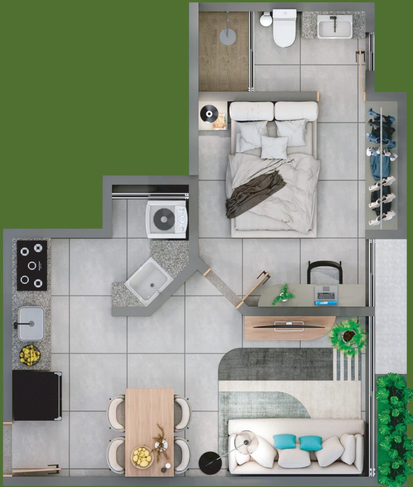
Apto tipo F 35,30m 2