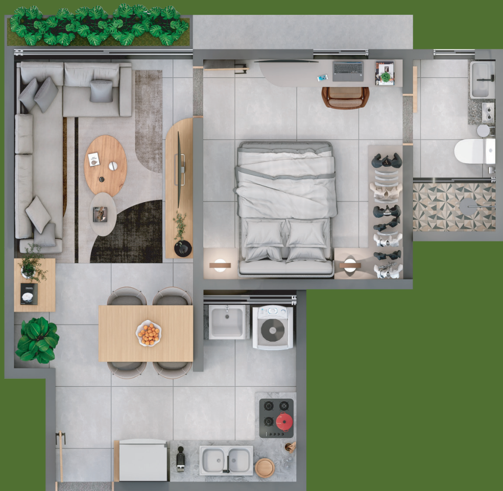
Apto tipo G 35,30m 2